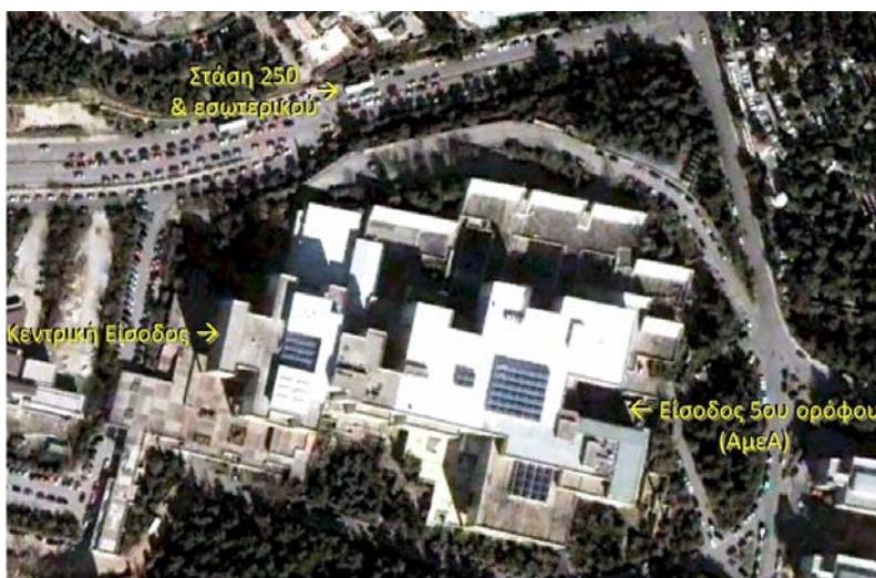
Αεροφωτογραφία του κτηρίου της Φιλοσοφικής Σχολής και του περιβάλλοντος χώρου