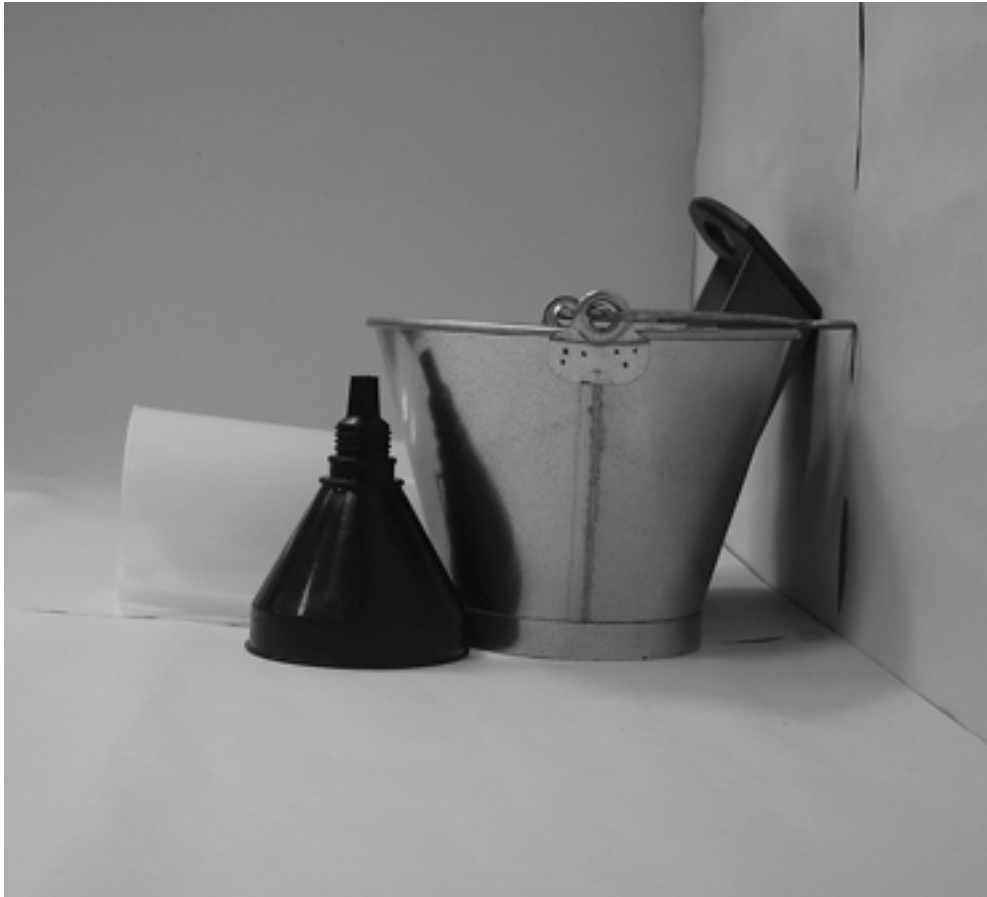
τέταρτη φωτογραφία: πλάγια όψη