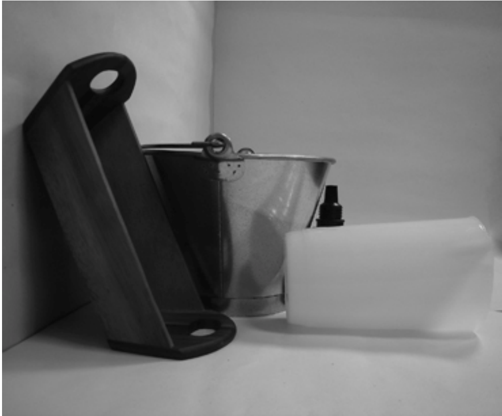
τρίτη φωτογραφία: πλάγια όψη