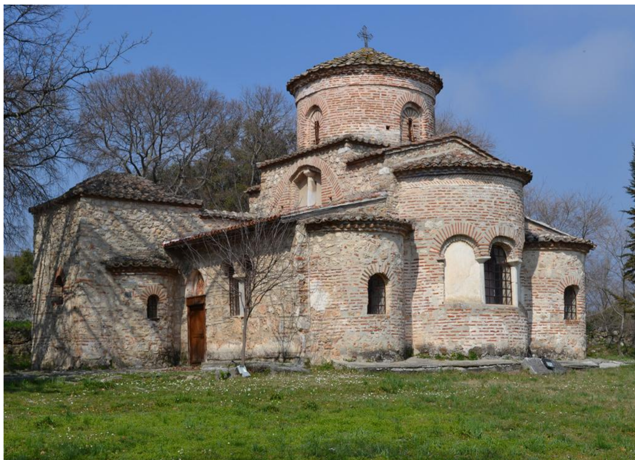
Βυζαντινός Ναός Παναγίας στην Κονταριώτισσα Византийский Храм Богородицы в н.п. Кондариотисса