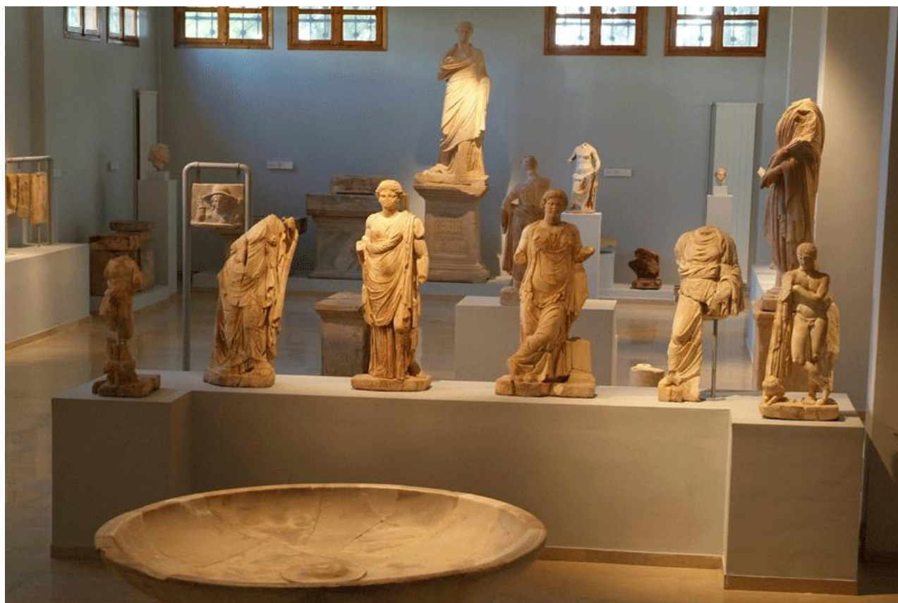
Αρχαιολογικό Μουσείο Δίου