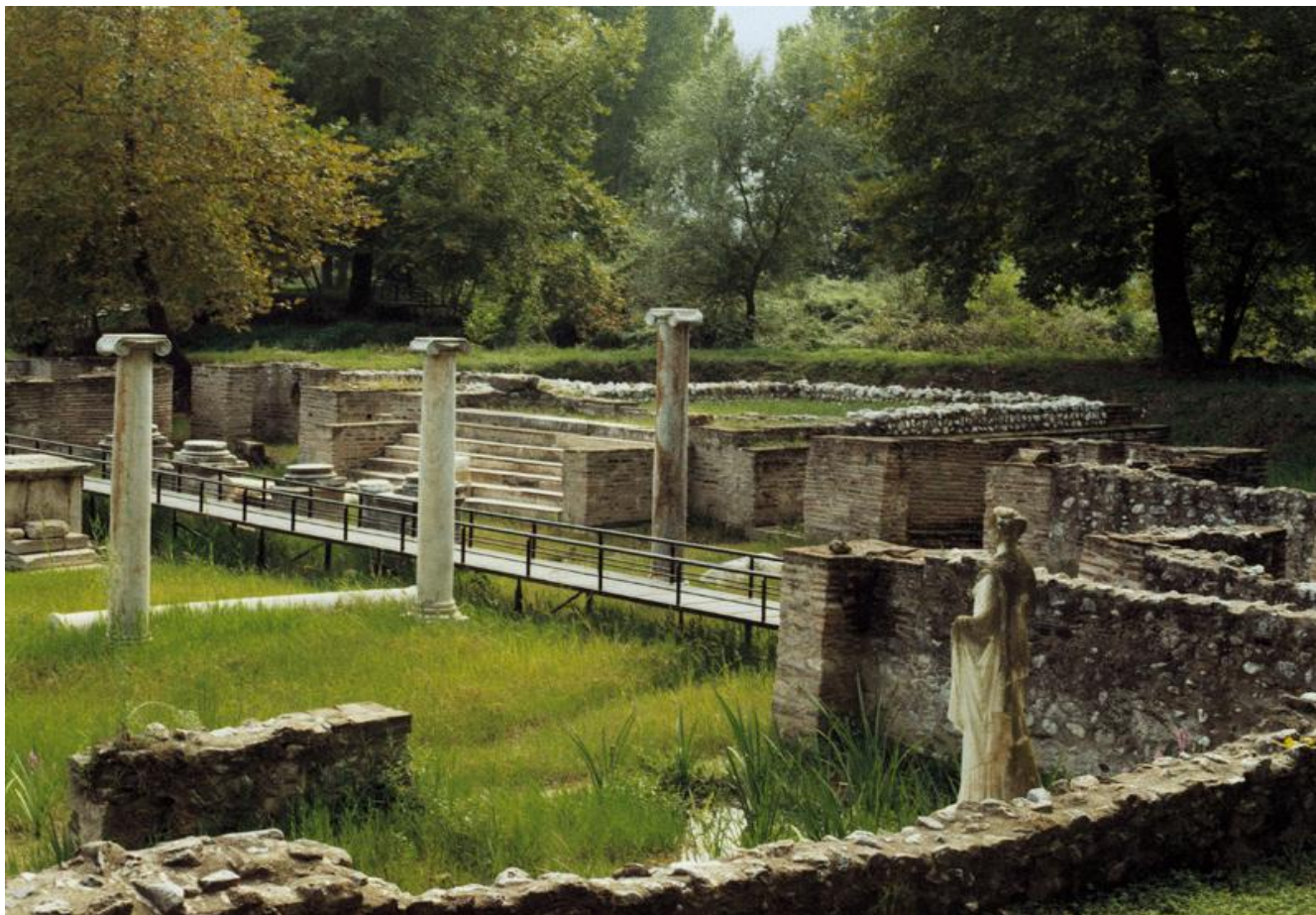
Αρχαιολογικό Πάρκο Δίων