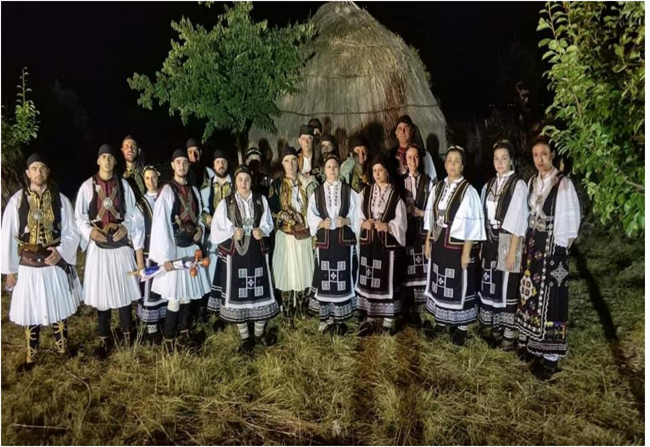
Παραδοσιακές Ενδυμασίες Σαρακατσαναίων Каракачанская национальная одежда