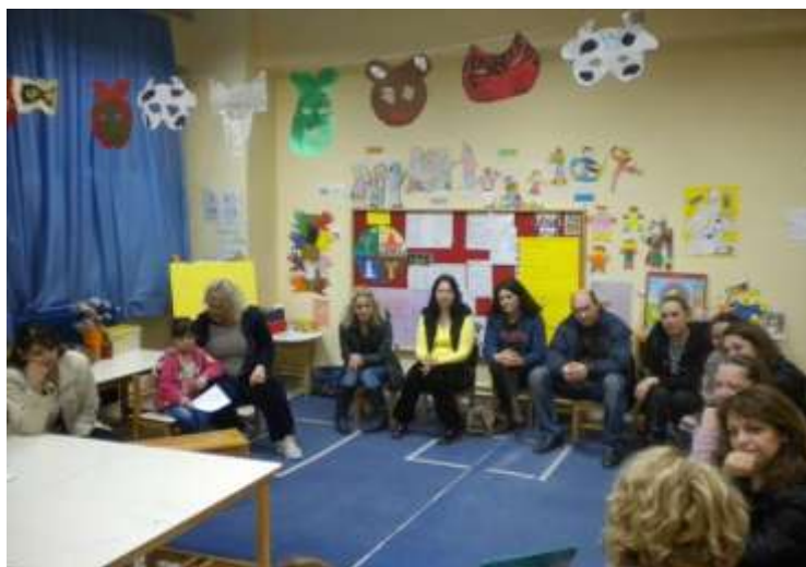
Σχ. έτος 2013-14