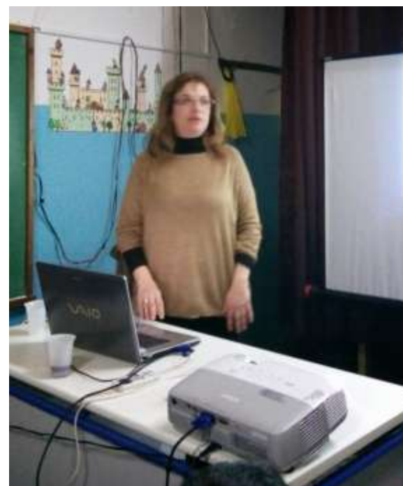
Σχ. έτος 2014-15